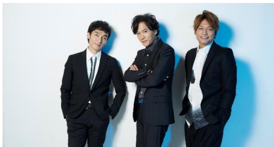
稲垣吾郎 / 草彅剛 / 香取慎吾