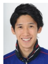
吉村 真晴 【卓球】